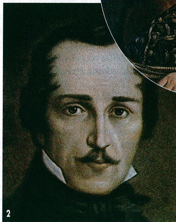
1. José Antonio Páez. 2. Francisco de Paula Santander. Estos caudillos incidieron en la disolución de la Gran Colombia.